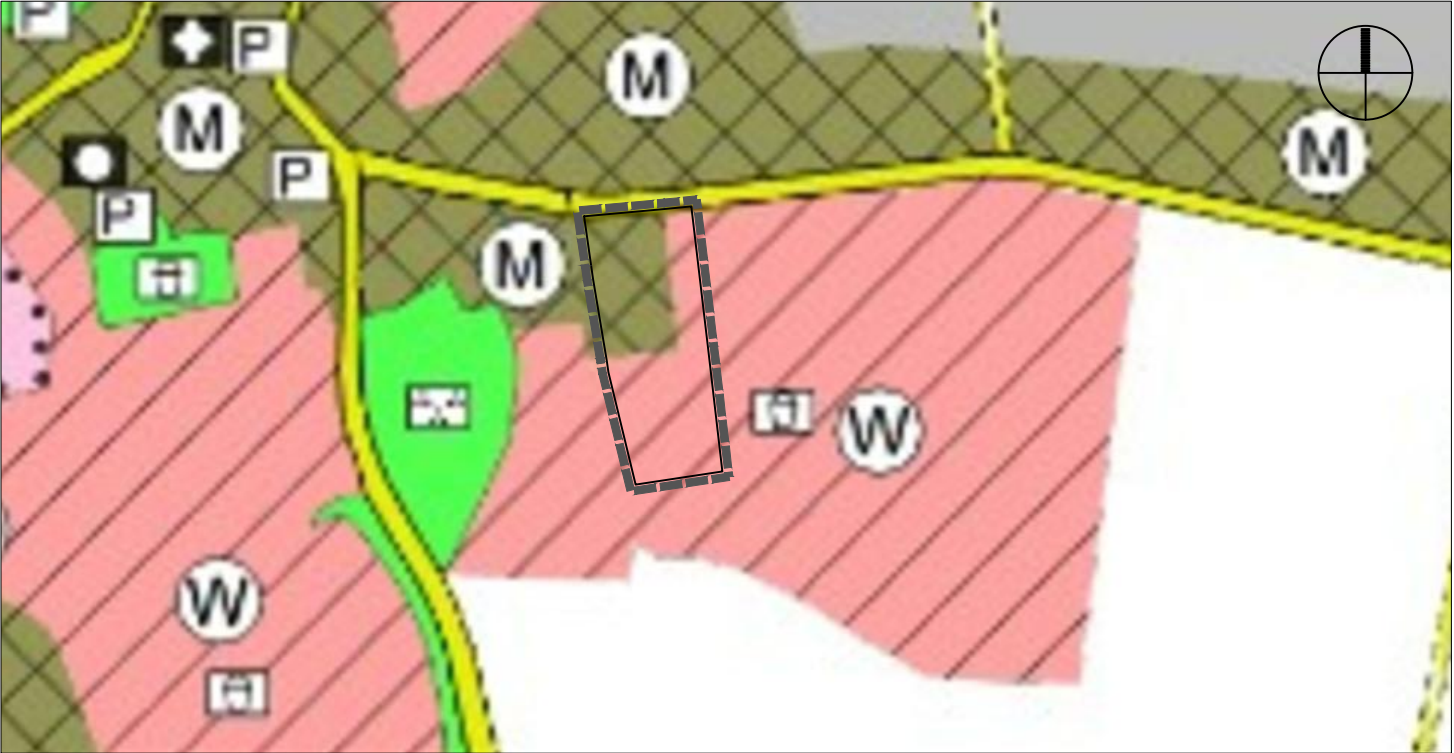
Rechtswirksamer FNP der Stadt Melle